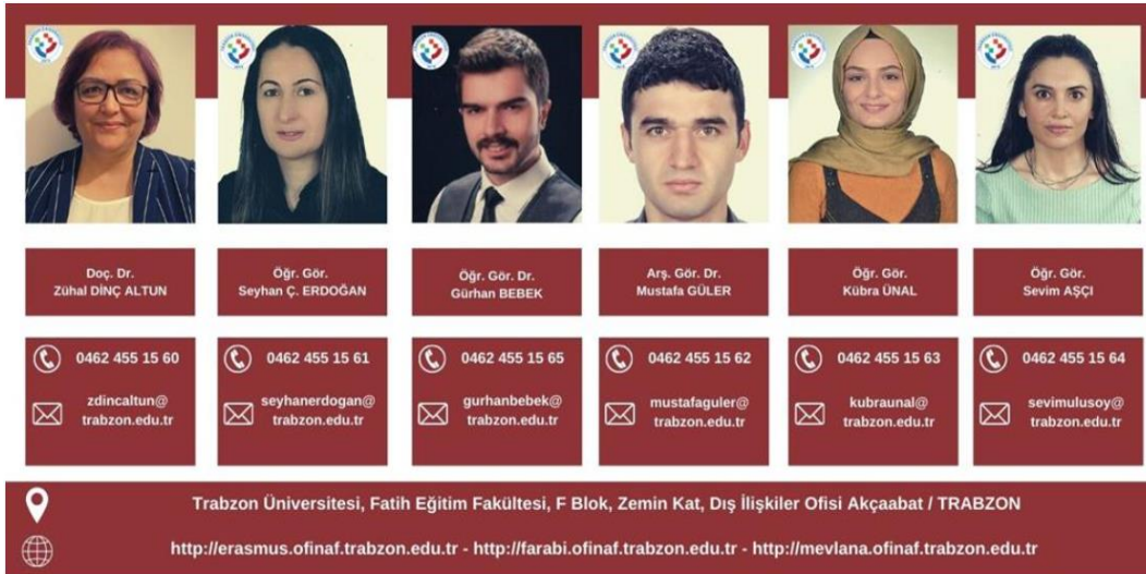
Resim 2. TRU Dış İlişkiler Kurum Koordinatörlüğü Personel Bilgisi

Erasmus+ Değişim Programı Hareketliliği, Farabi Değişim Programı Hareketliliği ve Mevlâna Değişim Programı Hareketliliği olmak üzere üç ayrı değişim programı bulunan koordinatörlük bünyesinde her bir değişim programı hareketliliğinin kendine özgü parametreleri ve dinamikleri bulunması nedeniyle koordinatörlükte görev yapan bireyler arasında görev dağılımı sağlanarak organizasyon süreci yürütülmektedir. Erasmus+ değişim programı hareketliliğine yönelik bilgilere https://erasmus.trabzon.edu.tr/ linki üzerinden, Farabi değişim programı hareketliliğine yönelik bilgilere https://farabi.trabzon.edu.tr/ linki üzerinden ve Mevlana değişim programı hareketliliğine yönelik bilgilere ise https://mevlana.trabzon.edu.tr/ linki üzerinden ulaşabilmek mümkündür. Dış İlişkiler Kurum Koordinatörlüğü biriminde sorumlu olan personellere ait bilgiler Resim 2’de sunulmuştur. Ayrıca bu bilgiye https://ofinaf.trabzon.edu.tr/S/3369/ekibimiz linki üzerinden de ulaşabilmek mümkündür.