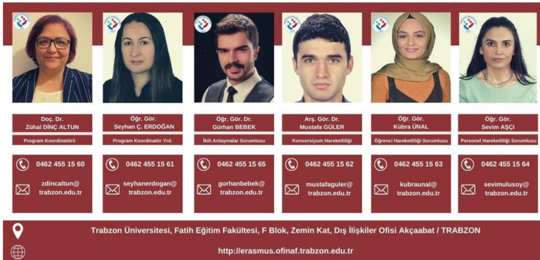
Resim 3. Erasmus+ Değişim Programı Hareketliliği Personel Bilgisi ve Sorumluluklar

Dış İlişkiler Kurum Koordinatörlüğü bünyesinde bulunan değişim programı hareketliliklerinden birisi olan Erasmus+ değişim programı hareketliliğinde görev alan personellere ve sorumluluklarına ait bilgiler Resim 3’te sunulmuştur. Ayrıca bu bilgiye https://erasmus.trabzon.edu.tr/S/4111/ekibimiz linki üzerinden de ulaşabilmek mümkündür.