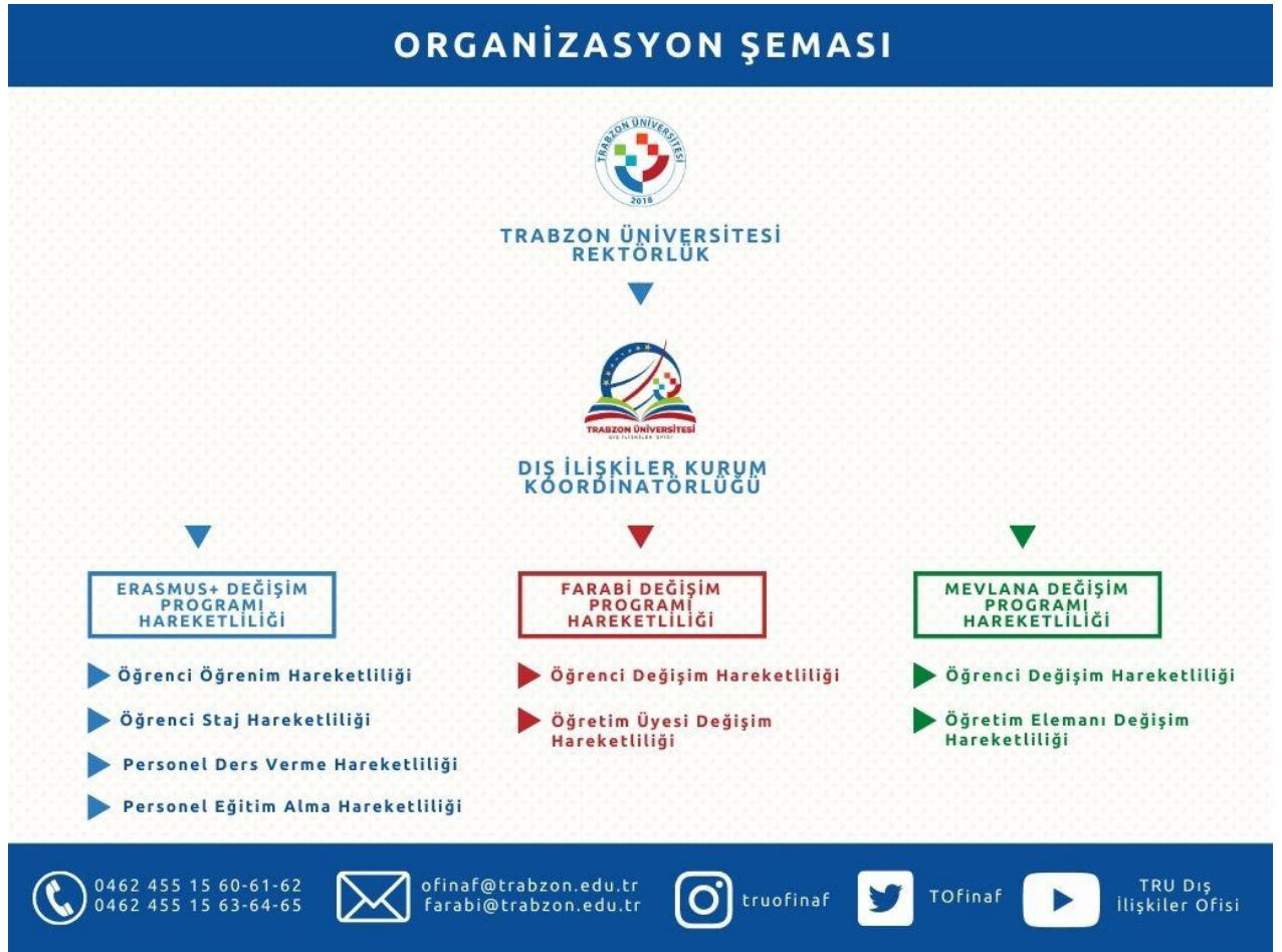
Resim 1. TRU Dış İlişkiler Kurum Koordinatörlüğü Organizasyon Şeması

Dış İlişkiler Kurum Koordinatörlüğü bünyesinde Erasmus+ Değişim Programı Hareketliliği, Farabi Değişim Programı Hareketliliği ve Mevlâna Değişim Programı Hareketliliği olmak üzere üç ayrı değişim programı hareketliliği bulunmaktadır. Bu hareketliliklere ve alt basamaklara yönelik organizasyon şeması oluşturulmuş ve Resim 1’de sunulmuştur. Ayrıca bu bilgiye https://ofinaf.trabzon.edu.tr/S/3367/organizasyon-semasi linki üzerinden de ulaşabilmek mümkündür.