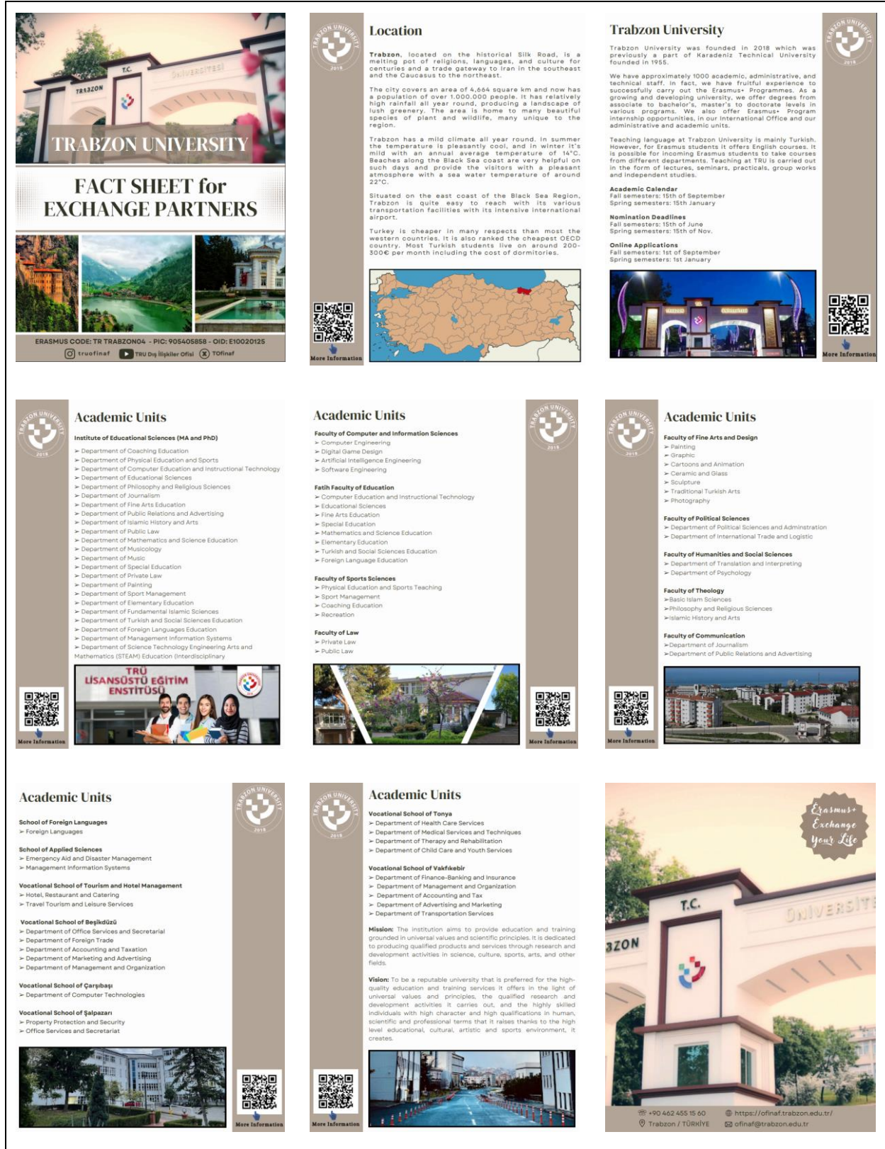
Resim 7. Dış İlişkiler Kurum Koordinatörlüğü - Trabzon Üniversitesi Bilgi Formu

Öte yandan kurumun uluslararası görünürlüğüne arttırmak ve ikili iş birliği sayısını arttırabilmek adına “Fact Sheet for Exchange Partners” belgesi oluşturulmuştur. Trabzon şehrinin lokasyonu, Trabzon Üniversitesinin kuruluş süreci, üniversitenin kurumsal yapısı, akademik birimleri, misyon ve vizyonu gibi konu alanlarında bilgiler yer alan bu form Resim 7’de sunulmuştur. Ayrıca bu forma https://ofinaf.trabzon.edu.tr/Share/9F5D932BC18EB19B19A0EB25C7504148 linki üzerinden de ulaşabilmek mümkündür.