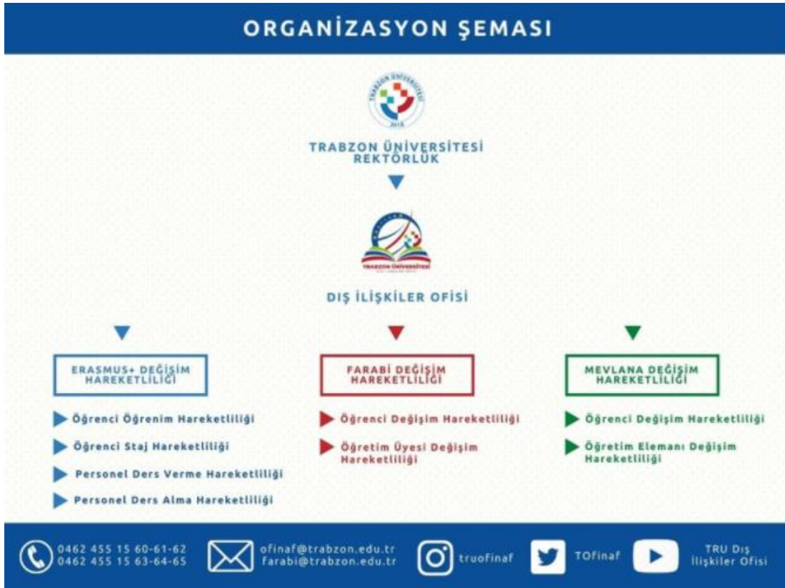
Resim 1. TRU Dış İlişkiler Kurum Koordinatörlüğü Organizasyon Şeması

Dış İlişkiler Kurum Koordinatörlüğü bünyesinde Erasmus+ Değişim Programı Hareketliliği, Farabi Değişim Programı Hareketliliği ve Mevlâna Değişim Programı Hareketliliği olmak üzere üç ayrı değişim programı hareketliliği bulunmaktadır. Bu hareketliliklere ve alt basamaklara yönelik organizasyon şeması oluşturulmuş ve Resim 1’de sunulmuştur. Ayrıca bu bilgiye https://ofinaf.trabzon.edu.tr/S/3367/organizasyon-semasi linki üzerinden de ulaşabilmek mümkündür.