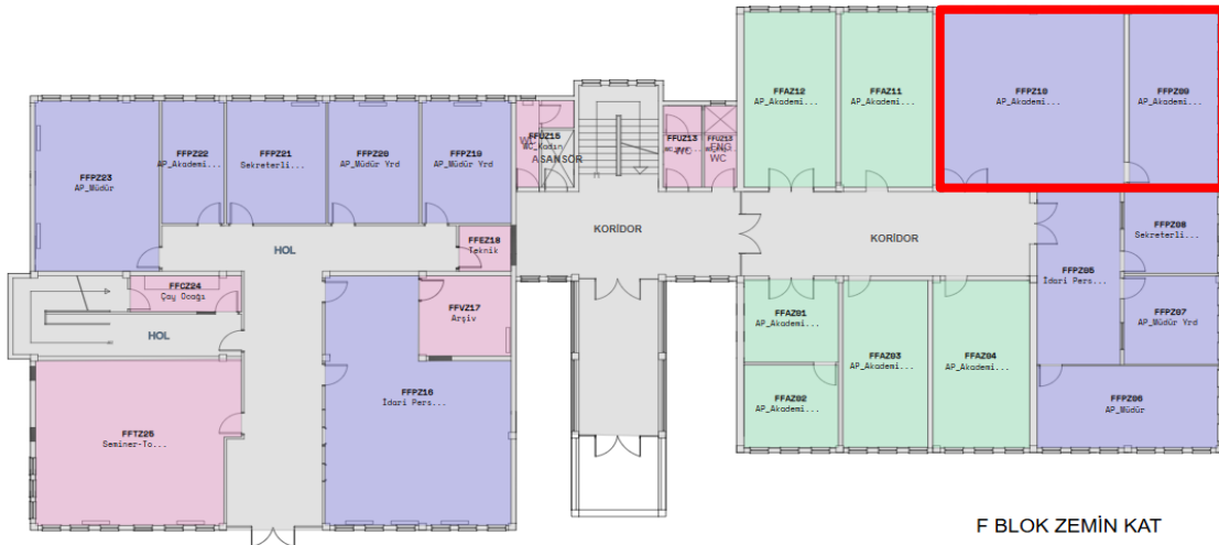
Resim 1. Dış İlişkiler Kurum Koordinatörlüğü Yerleşim Planı

FFPZ09 (27,88 m 2 ) ve FFPZ10 (56,97 m 2 ) olmak üzere iki odadan meydana gelen dış ilişkiler kurum koordinatörlüğü toplamda 84,85m 2 çalışma alanına sahiptir ve Fatih Eğitim Fakültesi F Blok zemin katta yer almaktadır. Koordinatörlüğe ait yerleşim planı Resim 1’de sunulmuştur.