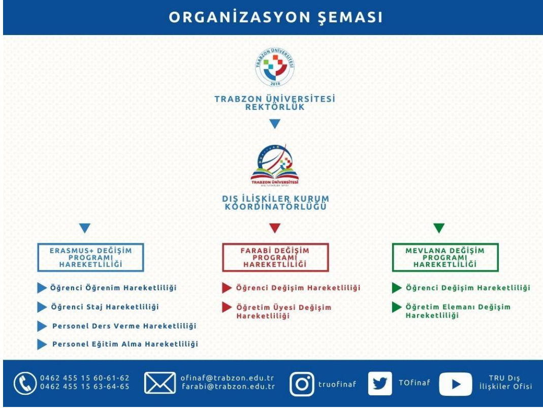
Resim 2. Dış İlişkiler Kurum Koordinatörlüğü Organizasyon Şeması